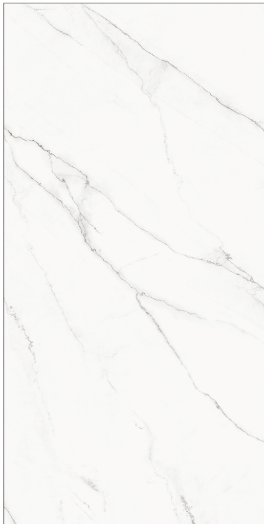
163 x 324 cm (64.17" x 127.56") Poli FD.IN.LCN.64x128.PL