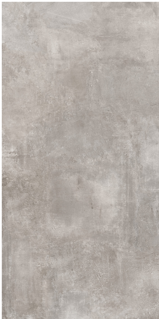
163 x 324 cm (64.17" x 127.56") Mat FD.PL.HOO.64x128.MT

Tous les items présentés dans ce document font partie du programme d'inventaire Olympia . Pour les commandes spéciales, veuillez contacter votre représentant de Tuiles Olympia.