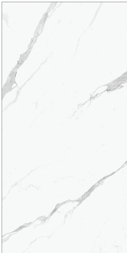
163 x 324 cm (64.17" x 127.56") Poli FD.IN.STT.64X128PL.A