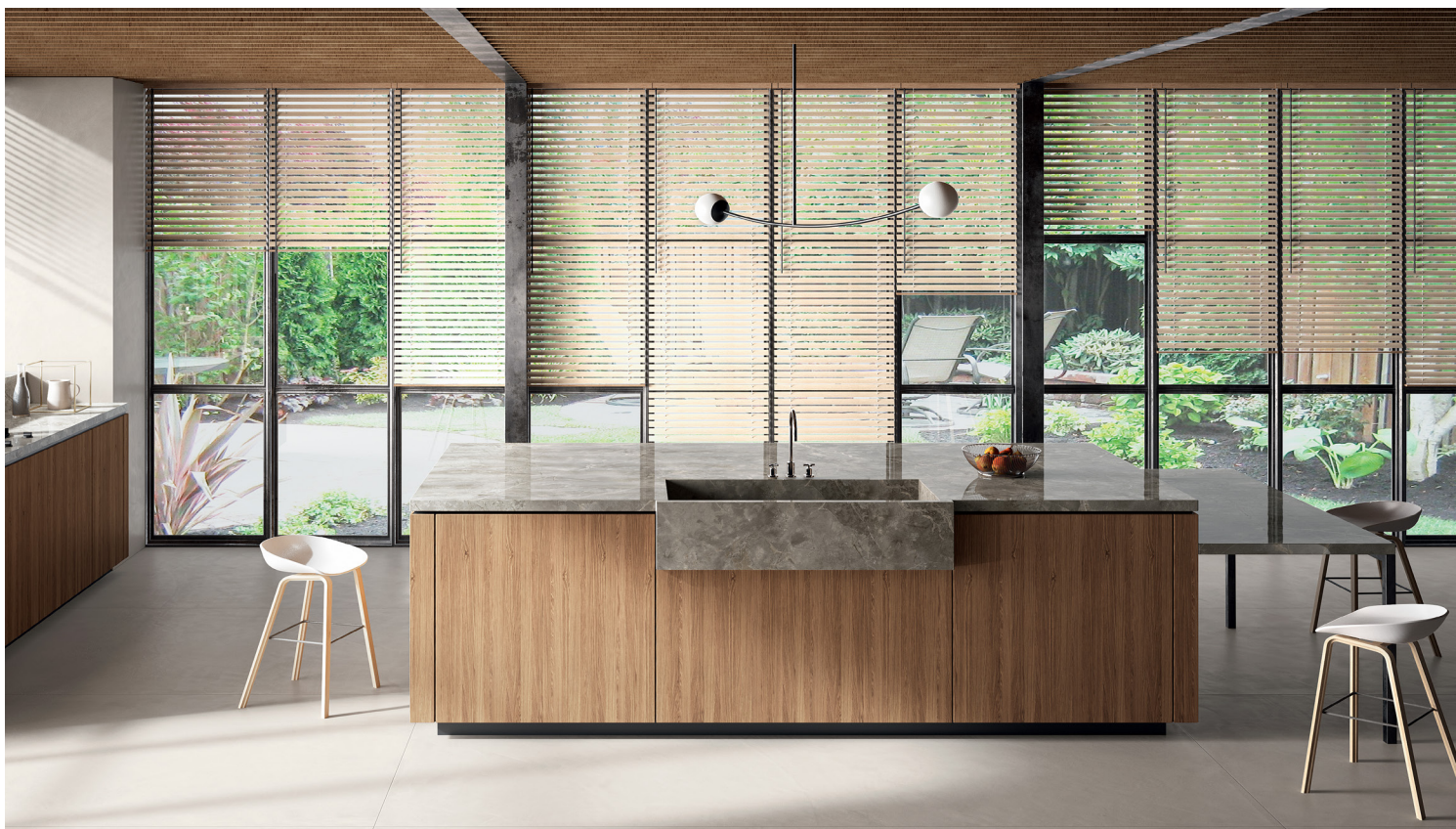
INFINITO - FIOR DI BOSCO (Gris)