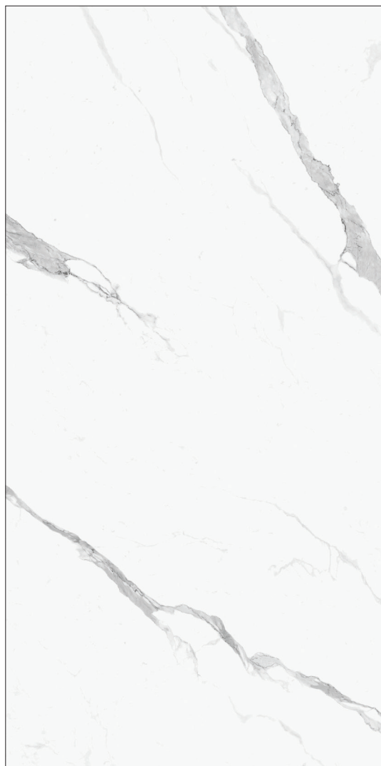
163 x 324 cm (64.17" x 127.56") Poli FD.IN.STT.64X128PL.B

***Veillez noter que le Book Match A & B doivent être vendus ensemble seulement.***