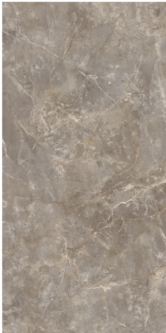
163 x 324 cm (64.17" x 127.56") Poli FD.IN.FDB.64x128.PL

Tous les items présentés dans ce document font partie du programme d'inventaire Olympia. Pour les commandes spéciales, veuillez contacter votre représentant de Tuiles Olympia.